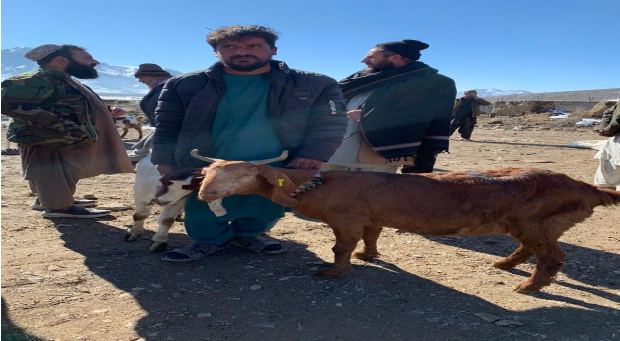
نمای از جریان توزیع بز درولسوالی موسسه

به تعداد (1800) بزهای شیری به همکاری موسسه محترم اسلامیک ریلیف برای 900 فامیل یعنی به هر فامیل دوراس بز شیری درولسوالی های موسسه و شکر دره توزیع گردیده است.