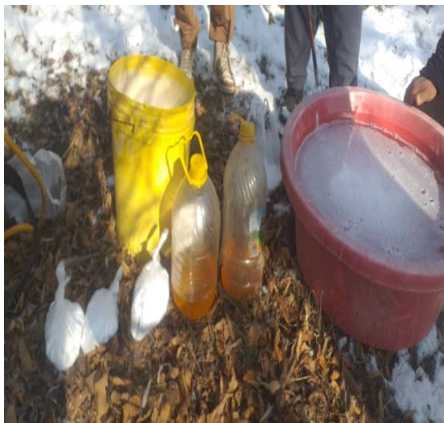
نمای از جریان ساخت تهیه و استعمال روغن های زمستانی