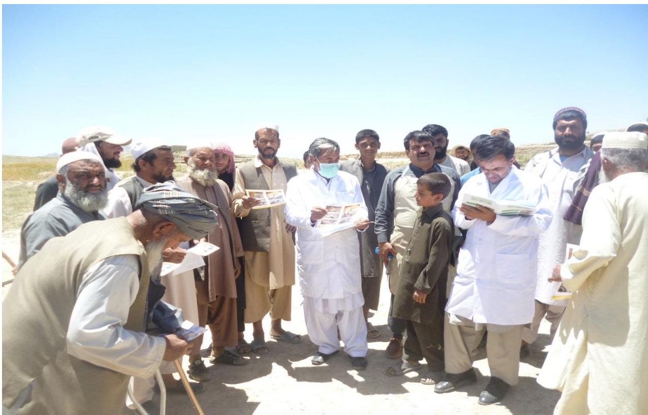
نمای از جریان توزیع بروشوره مالداران

غرض بلند بردن سطح آگاهی مالداران در مورد مرض لمپی سکین تعداد (1500) ورق بروشورمعلومات در مورد مرض لمپی سکین به مالداران ولسوالی های ولایت کابل توزیع گردید.