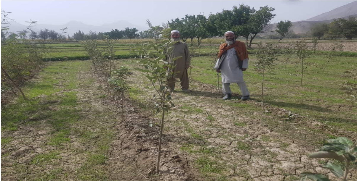
نمای از باغ های احداث شده طی سال جاری

طی سال 1401 از طریق مقام محترم وزارت زراعت آبیاری ومالداری از مساعادت همکاری موسسه IHH کشور دوست ترکیه به تعداد (1815) اصله نهال جهت احداث باغ های متراکم سیب، بهی و ناک به این اداره غرض توزیع به باغداران علاقمند انتقال وتسلیم داده شده بود. که نهال های متذکره بعد از سهمیه بندی برای 12 تن از باغداران در ولسوالی های موسهیی، چهار آسیاب، بگرامی، خاکجبار توزیع گردیده است و در 7 جریب زمین غرض شده است.