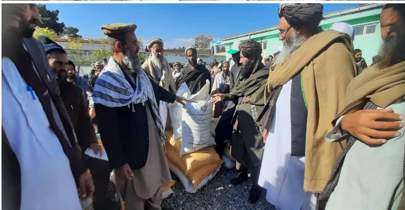
نمای از جریان توزیع گندم بذری و کود های کیمیای