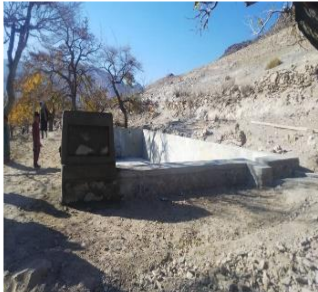
نماهای از ذخیره آب زراعتی ولسوالی موسه‌هی