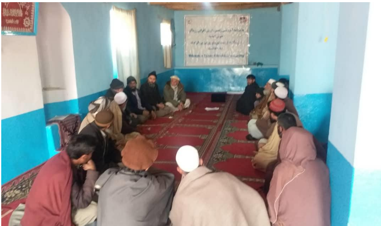
نمای از جریان برنامه آموزشی