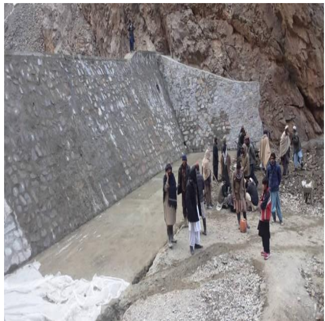
نما های از چکدم قریه چکری ولسوالی خاکجبار