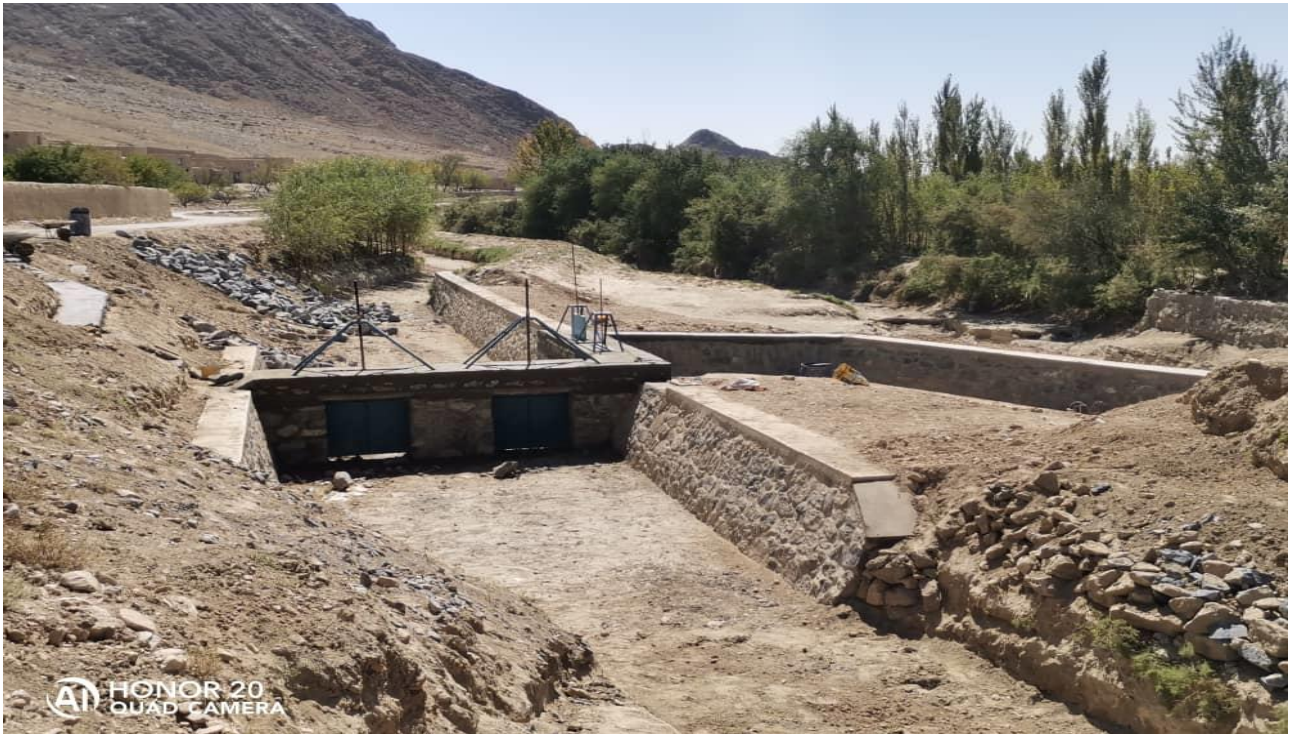
نمای از سربند قریه عبدالرحیم زی ولسوالی موسهی

در جریان سال جاری سربند قریه عبدالرحیم زی ولسوالی موسهی اعمارگردیده است. سربند یاد شده بیش از 500 جریب زمین را تحت آبیاری قرارداده در رشد وانکشاف زراعت تاثیر مثبت دارد.