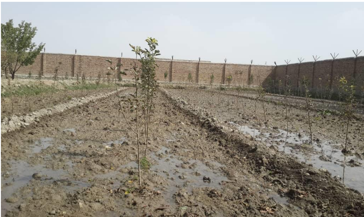
نمای از باغ های احداث شده طی سال جاری