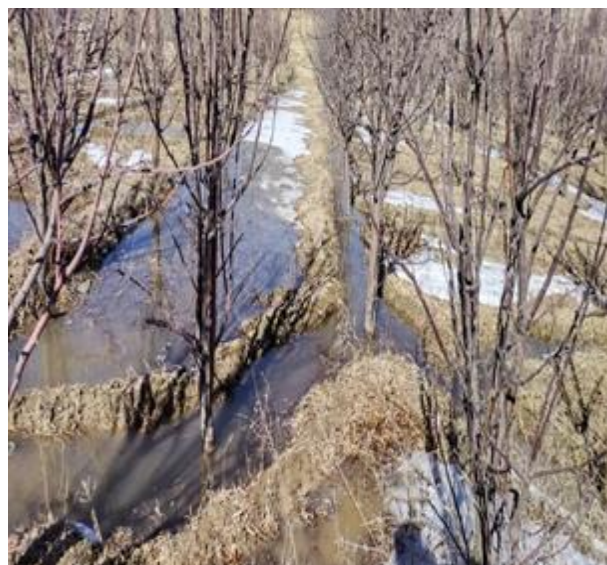
نمای از یخ آب نمودن باغ ها