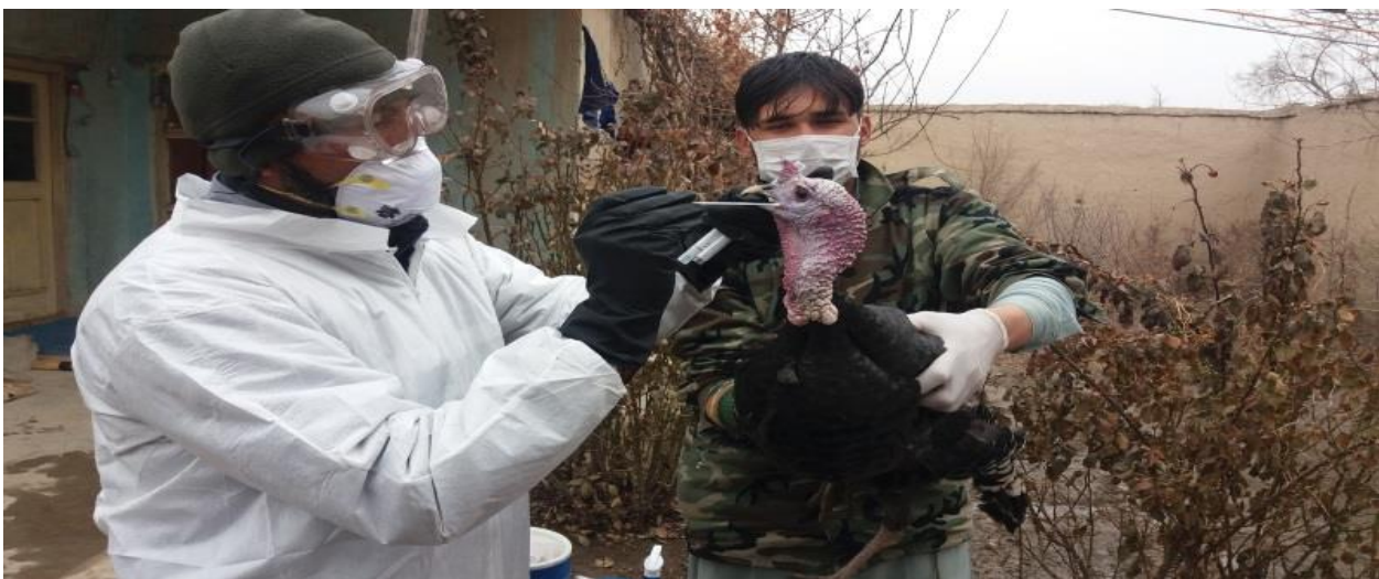
نمای از جریان جمع آوری نمونه یاسمپل

غرض تشخیص حقیقی امراض مشتبه به تعداد (851) نمونه از حیوانات مشتبه مصاب پرازیت خون، بروسلوز، پرازیت داخلی، نیوکاستل، طبق، LSD، هیموراجیک سپتسیمیا، اکتینومایکوز، تراپخمینوس و ماستایتس از ولسوالی های ولایت کابل جمع آوری و غرض تشخیص حقیقی به لابراتوار مرکزی ارسال شده است.