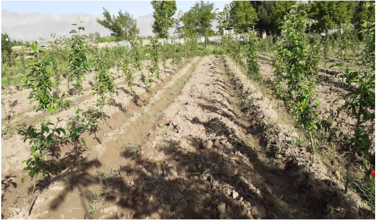
نمای ازباغ های احداث شده طی سال جاری