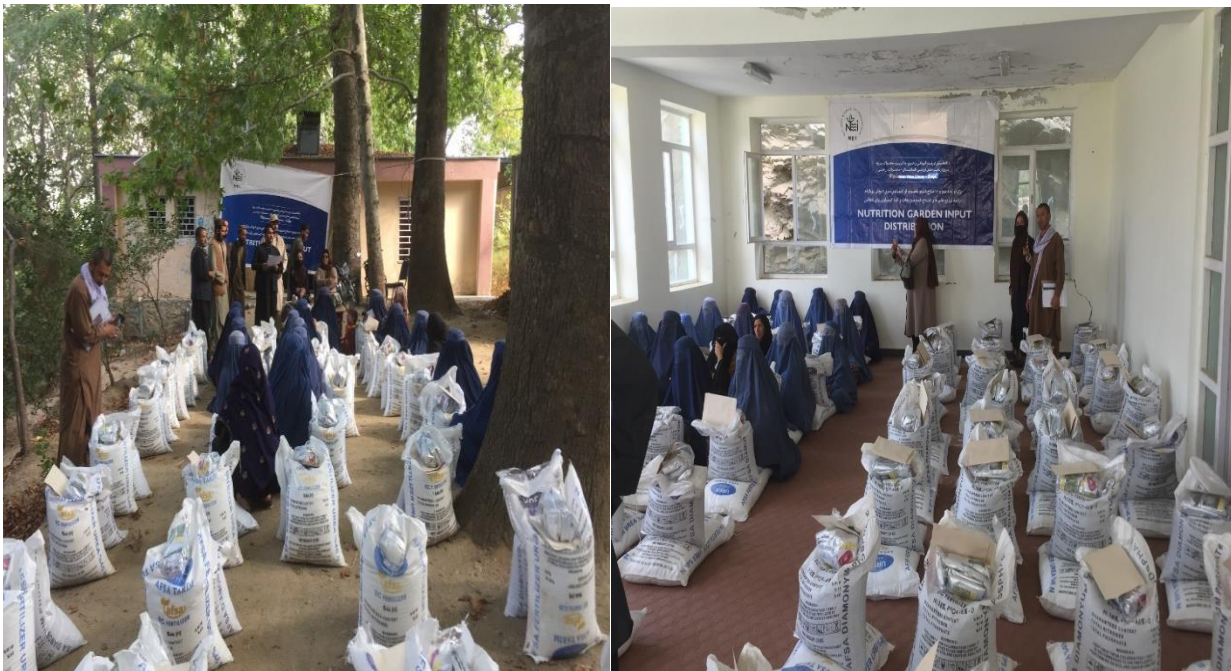
نمای از جریان برنامه آموزشی و توزیع مواد باغچه های خانگی

بعد از اینکه آموزش دهاقین تکمیل گردید برای خانم های دهاقین کار در 5 ولسوالی کابل یک بسته مواد کمکی که شامل کودسیاه ، کود سفید و 6 نوع تخم سبزیجات بود توزیع گردید که برای فی نفر دهقان 25 کیلوگرام کود سیاه یا DAP، 25 کیلوگرام کود سفید یا Ureal و یک بسته تخمیانته جات که شامل 6 نوع تخم سبزیجات (بامیه، پیاز، پالک، شلغم، بادنجان رومی و کدو) میباشد نیز توزیع گردید.