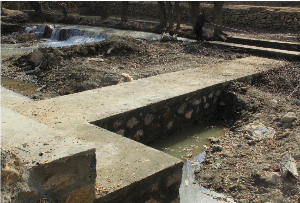
نمای از سربند قریه لکن خیل ولسوالی چهاراسیاب

در جریان امسال سربند قریه لکن خیل ولسوالی چهاراسیاب تکمیل و به بهره بردای سپرده شده است این چکدم 300 جریب زمین را تحت آبیاری قرار میدهد و مبلغ 360 هزار افغانی مصرف شده و کارآن تکمیل شده است و در جریان سال جاری زمینه کاربه مردم محل نیز مساعد گردیده است.