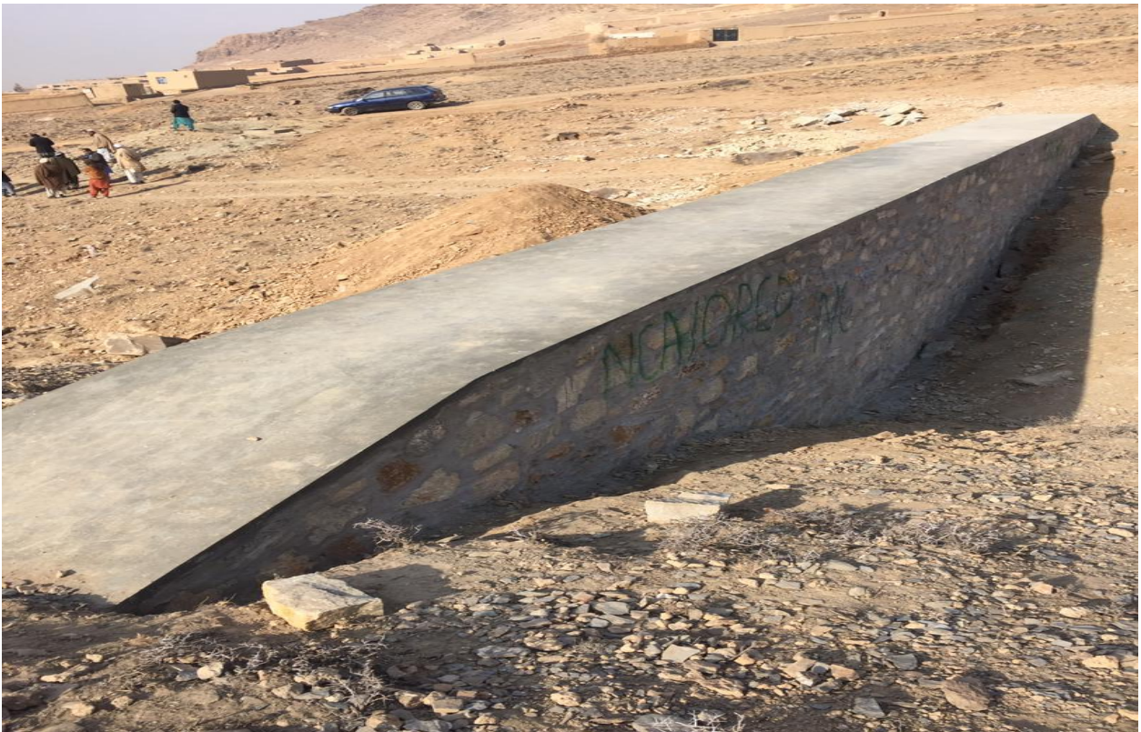
نمای از چکدم قریه بابه قشقار ولسوالی ده سبز

چکدم قریه بابه قشقار ولسوالی ده سبز: چکدم یاد شده به خاطر جلوگیری از تخریب زمین های زراعتی و تقویه آب های زیرزمینی ساخته شده است. چکدم متذکره 250 جریب زمین را تحت ایاری قرار میدهد. همچنان 176 مترمکعب سنگ کاری شده 1200 مترمکعب آب را ذخیره نموده و مبلغ 3 صدو 79 هزار 400 افغانی مصرف شده و کار آن تکمیل شده است.