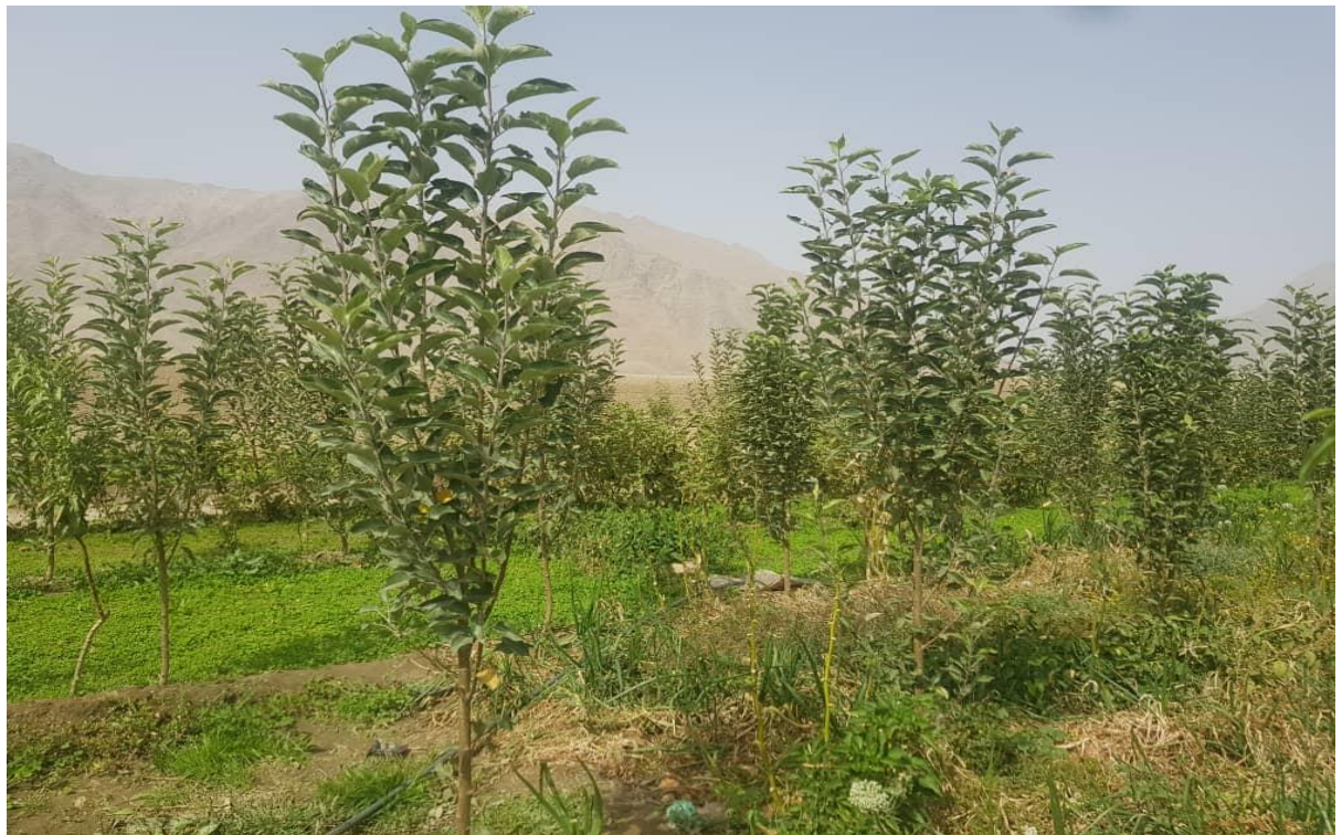
نمای ازباغ های احداث شده طی سال جاری