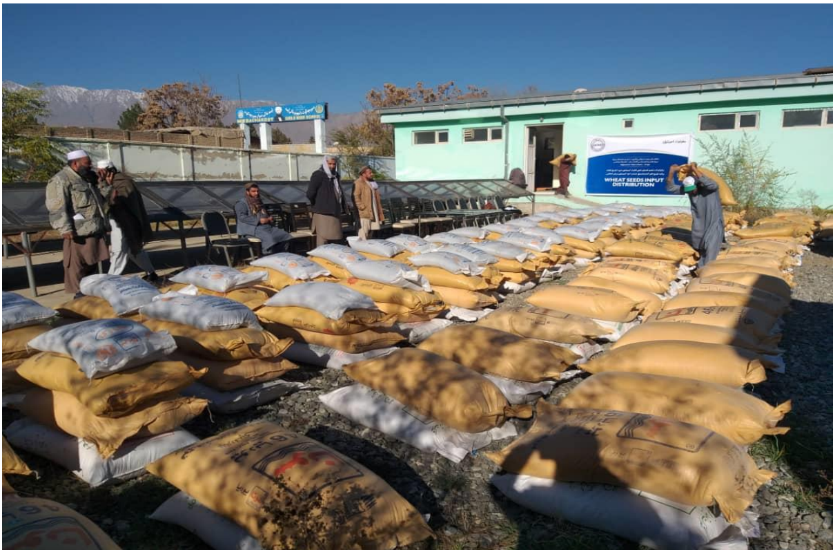
جریان توزیع گندم وکود کیمیای در ولسوالی کلکان

به مقدار (1.55) متریک تن آنرا برای دهاقین مستحق وعلاقمند ولسوالی ها توزیع گردیده است .