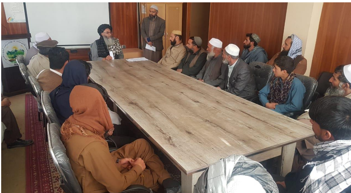
نمای از جریان تدویر برنامه آموزشی