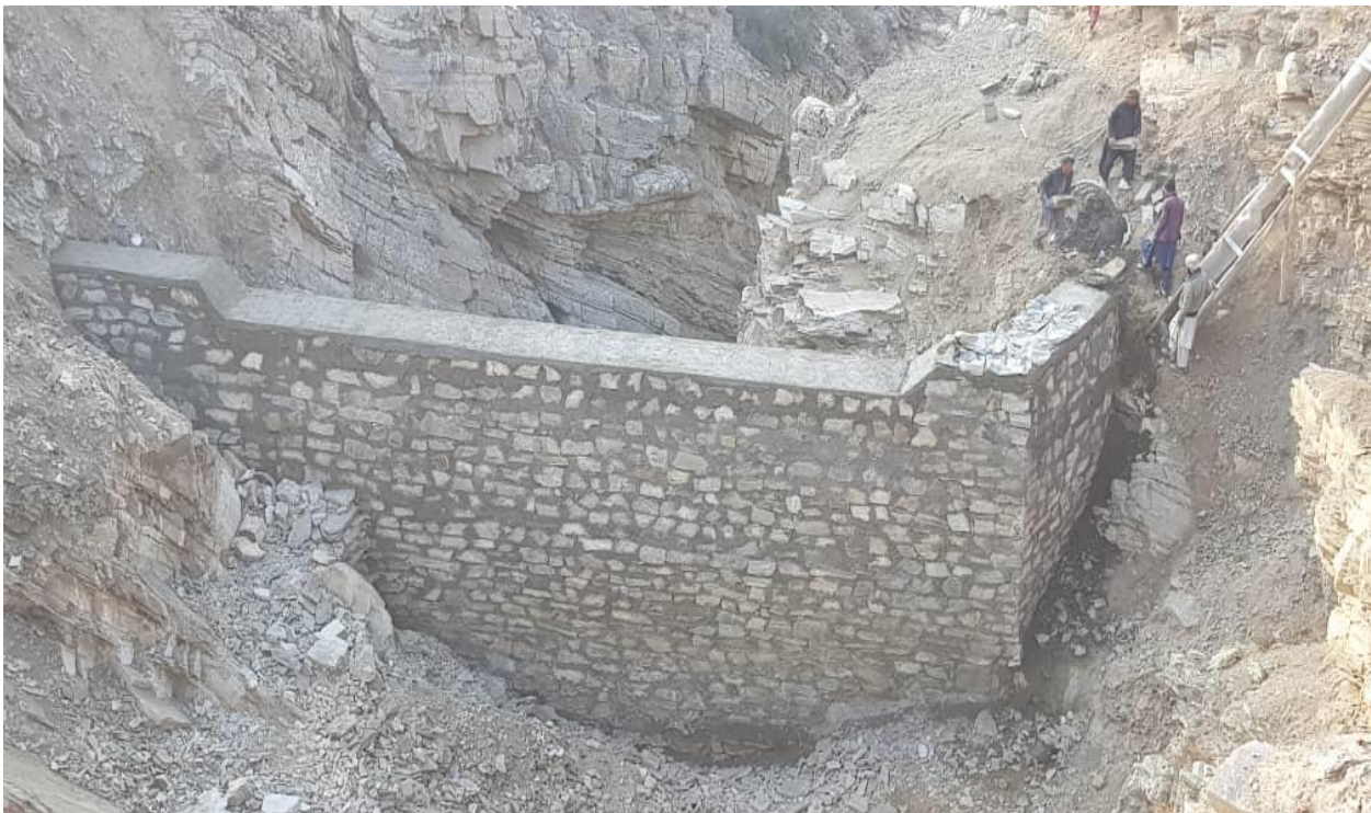
نمای از چکدم قریه شیخو ولسوالی ده سبز

در جریان سال جاری یک چکدم جهت ذخیره آب زراعتی در قریه شیخو ولسوالی ده سبز اعمار شده است. این چکدم 450 جریب زمین را تحت آبیاری قرار داده و مبلغ 3 صدو 36 هزار 850 افغانی هزینه شده است. چکدم یاد شده 181 مترمکعب سنگ کاری شده و 400 مترمکعب آب را ذخیره مینماید و کار آن تکمیل شده است.