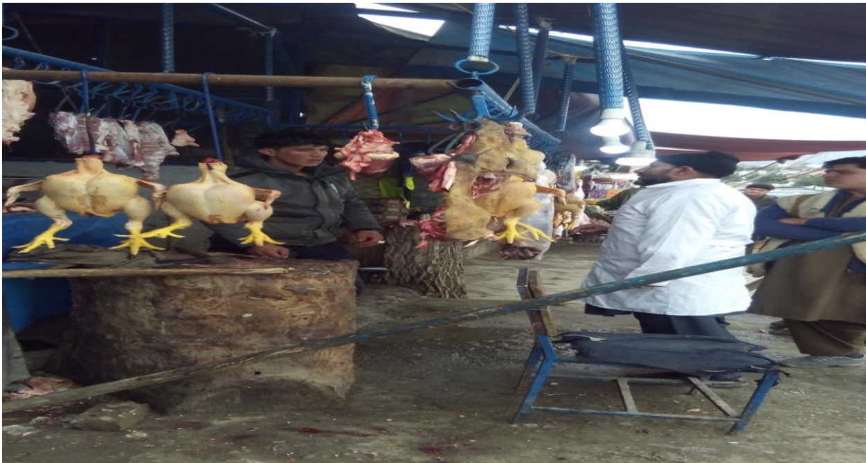
نمای از جریان کنترل محصولات حیوانی

غرض بدست آوردن محصولات صحتی و سالم به تعداد (14086) فرد و راس گوشت گاو، گوسفند و بز به تعداد (71971) قطعه گوشت مرغ، به مقدار (9339) کیلوگرام چکه، به مقدار (106242) لیتر شیر، به تعداد (282498) بیضه تخم مرغ، به مقدار (2558) کیلوگرام پنیر و به مقدار (3657) کیلوگرام مسکه بعد از معاینات ارگانولپتیک در سطح ولسوالی های ولایت کابل اجازه فروش داده شده است.