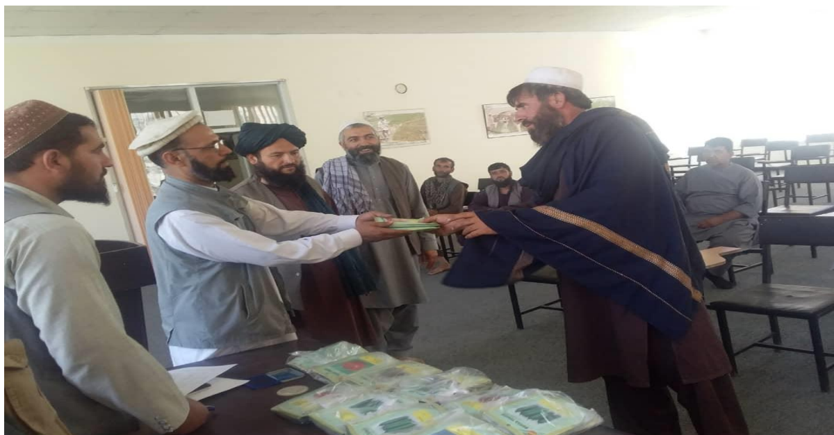
نمای از جریان توزیع تخم یانه جات در ولسوالی شکرده

از کمک های کشور دوست ترکیه به مقدار ( 2478 ) پاکت تخم یانه جات سبزیجات مختلف النوع از قبیل ( دونوع بادنجان رومی، بامیه ، فاصلیه ، مرچ سبز، مرچ سرخ، کرم، ملی سرخک، کدوگگ، نوش پیاز، بادرنگ، بادنجان سیاه ) به وزن های مختلف از طریق مدیریت خدمات زراعتی ولسوالی ها برای (310) نفر دهاقین سبزی کار بطور رایگانه توزیع گردیده است .