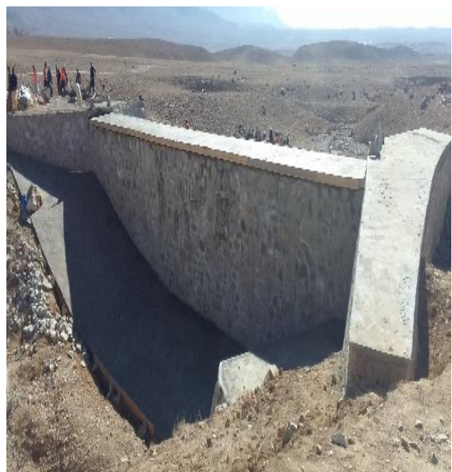
نماهای از چکدم ولسوالی قریه بابه قشقار ولسوالی ده سبز