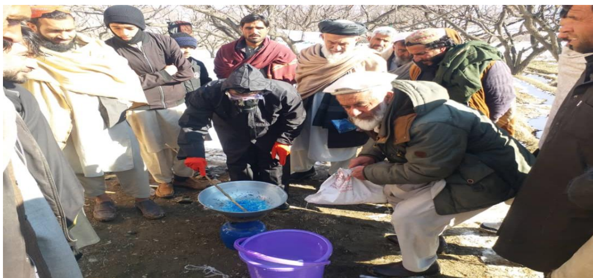
نمای از جریان برنامه آموزشی عملی