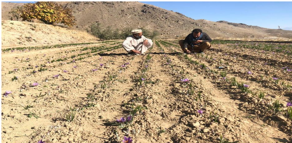
نمای از قطعه نمایشی زعفران

4 قطعه نمایشی زعفران در همکاری با موسسه محترم ORCD از جمله دو قطعه درولسوالی ده سبز برای دو نفر و دو قطعه درولسوالی چهارآسیاب به دو نفر از دهاقین علاقمند هر قطعه در مساحت سه بسوه به مقدار (250) کیلو گرام پیاز زعفران ایجاد شده است.