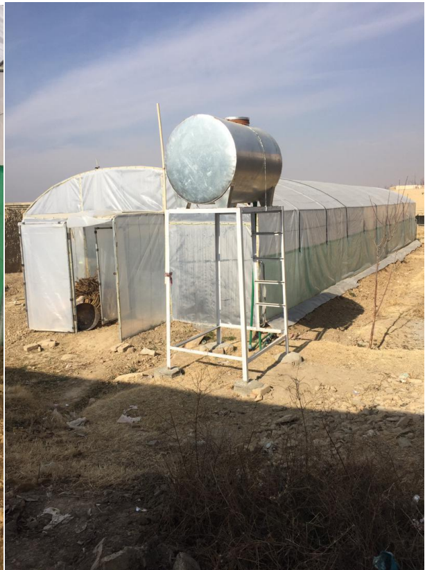
نمای از سبزخانه احداث شده در قریه بابه قشقار ولسوالی ده سبز