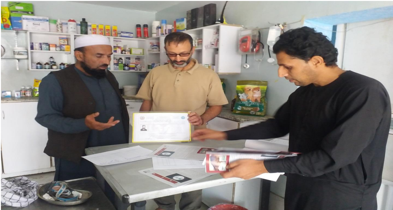
نمای از جریان کنترل کلینیک های صحت حیوانی

غرض بهبود خدمات صحتی به تعداد (71) کلینیک صحت حیوانی در مرکز وو لسوالی های ولایت کابل کنترل و بررسی گردیده است.