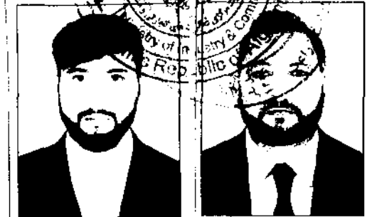
مرستیال / V-President

Bashir Khan Basharmal Construction And Road Building Company