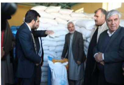
برای دو هزار و ۳۲۰ دهقان در ولایت

باید گفت که هم‌چنان وزارت زراعت، آبیاری و مالدارۍ برای حمایت از دهقانان ولایت هرات، پلان دارد تا در چارچوب برنامه‌ی ملی توزیع تخم‌های اصلاح‌شده‌ی گندم، یک‌هزار و ۱۰۰ تن تخم اصلاح‌شده را برای ۲۲ هزار دهقان دیگر ولایت هرات توزیع کند.