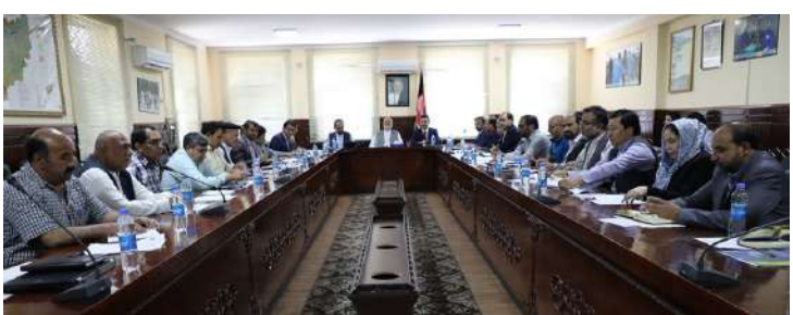
دکرنـي وزيـر وويـل، چـي افغانسـتان د چرگانـو د غوښو د توليد په برخه کې ځان بساينې ته نېږدې شيوې او د هېواد د چرگانيو د غوښو د

د مالـدارۍ د سکټور وده د هېـواد پـه اقتصـادي ځان بساينې او د خوړو د خونديتوب پـه برخـه كبي مهم رول لـري.