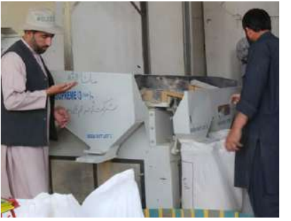
كړئ، چې تر دې دمه يې ۷۰ مټريك ټنه تصديق شوي تخمونه توليد كري او دالري

د لوگـر د کرنـی، اوبولگولـو او مالـدارۍ رياست وايسي، چمپي ددې ولايت دتخمونو توليدي شركتونه ميكانيزه شوي دي. ددې ولايت دکرنې رياست په خبره کابو درې کالـه مخکـې د لوگـر پـه برکـي بـرک ولسـوالۍ کې د کرنې وزارت د کلپ (ايکارډا) برنامي له خوا د ميربركات په نوم د تخمونو د توليد يو خصوصيي شركت جوړ او په پرمختللي ماشين الاتو سمبال شوه. ياد شركت د غنمو د تصديق شويو تخمونو د پروسس لړۍ پيل